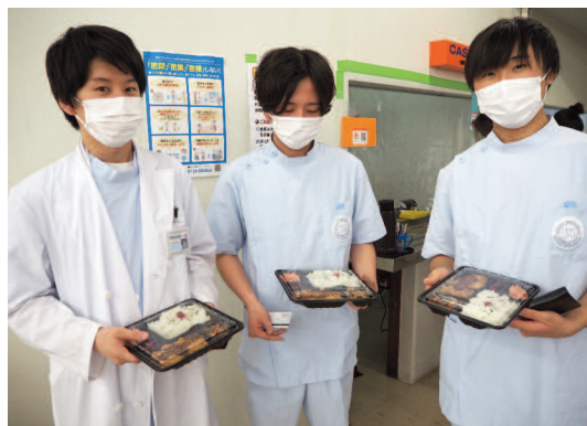
弁当を手にして笑顔の学生たち

焼肉&コロッケ弁当や韓国唐揚げ弁当、チキン南蛮弁当などバラエティ豊富なラインナップも学生たちに好評で、連日行列となる盛況ぶりだった。