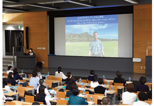
特別プログラムの様子（ハワイ大学からメッセージ）

た。今後も充実した内容のプログラムを設定し、満足度の高いイベントを実施していく。次回7月18日のオープンキャンパスでは、10月の入試に向けて総合型選抜の入試対策講座がスタートする。