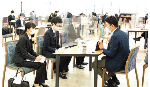
採用担当者の話を聞き熱心にメモをとる学生たち

熱心にメモをとりながら企業の話をついていた学生たちからは「仕事内容や職場の雰囲気など、気になることを直接質問でき、有意義だった」「今後の採用スケジュールなど、詳しい話をじっくりと聞くことができた」という声が聞か