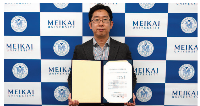
賞状を手にする原野准教授

「既存住宅取引における建物価格査定と取引価格との関係」 (都市住宅学 99号、2017年10月、90～95頁)