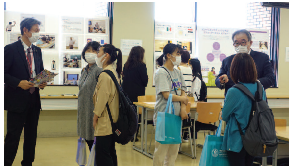
オープンキャンパスのHT学部コーナーで新メジャーの説明を聞く参加者たち