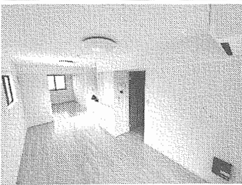
筆者が担当した賃貸住宅の内 部の様子

て、学業の傍ら、業務委託 で不動産賃貸の仕事を行っ ている。また、賃貸不動産 経営管理士の資格取得に向 けた勉強も進めており、こ れらの専門知識とスキルが 不動産賃貸事 業においてい かに重要かを 実感してい る。